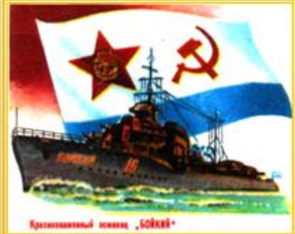
Краснознаменный эсминец «Бойкий»